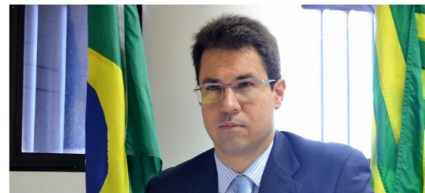
Dados do relatório mostram que a produtividade do Judiciário piauiense cresce a cada ano: em 2014, cada magistrado baixou 718 processos

Cada magistrado do Piauí julgou, em média, 1.105 processos no ano de 2017. São 95 processos julgados a mais por cada magistrado, se comparado ao ano anterior. Os números representam um aumento de 9,4% no Índice de Produtividade por Magistrado (IPM) e estão no anuário Justiça em Números 2018, divulgado nesta segunda-feira (27), pelo Conselho Nacional de Justiça (CNJ).