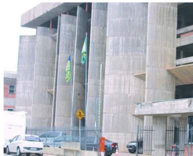
TJ-PI tem média de 1.105 processos julgados em 2017

solucionados por dia útil do ano, sem descontar períodos de férias e recessos considerando todo o Judiciário.